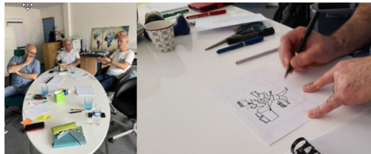
Par une illustration de concepts