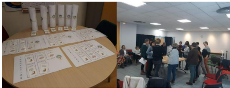
Par le jeu