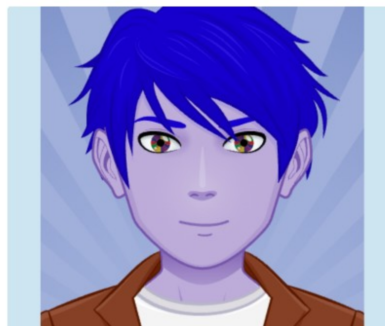
Médiateur numérique en bibliothèque