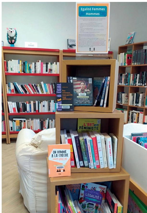
Saint-Cézerit – Kit citoyen Égalité Femmes Hommes

La constitution et la mise à disposition d'une collection « tout public » – sans autre distinction que leur âge – sont au cœur des savoir-faire du bibliothécaire. L'enjeu actuel majeur consiste à articuler ses ressources aux problématiques sociétales, dont ce Schéma se propose d'en brosser quelques-unes.