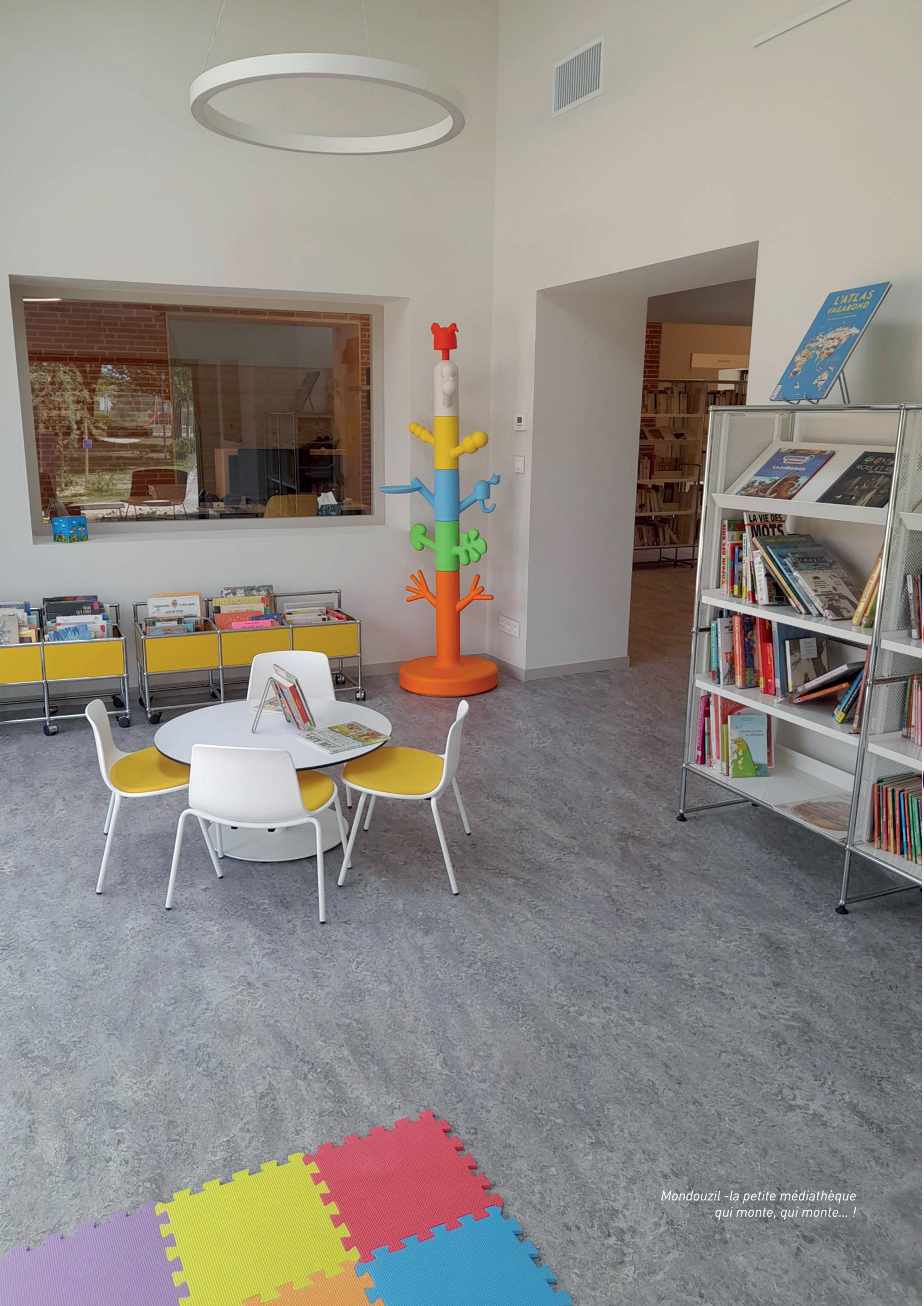
Mondouzil - la petite médiathèque qui monte, qui monte... !