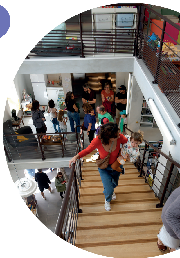
Lanta - la médiathèque prise d'assaut pour son inauguration

Médiathèque départementale de la Haute-Garonne