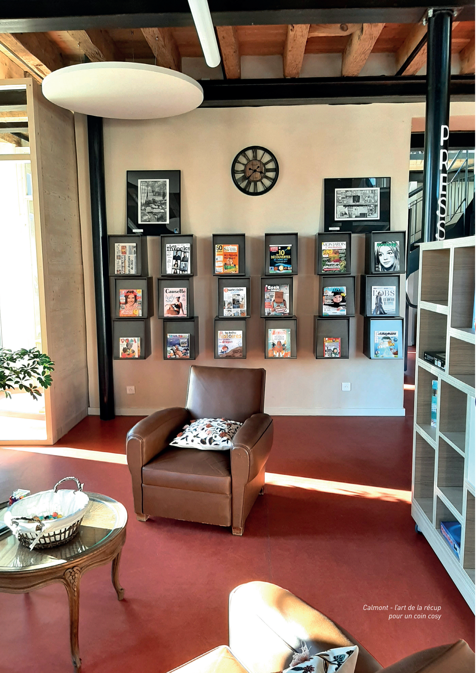
Calmont - l'art de la récup pour un coin cosy