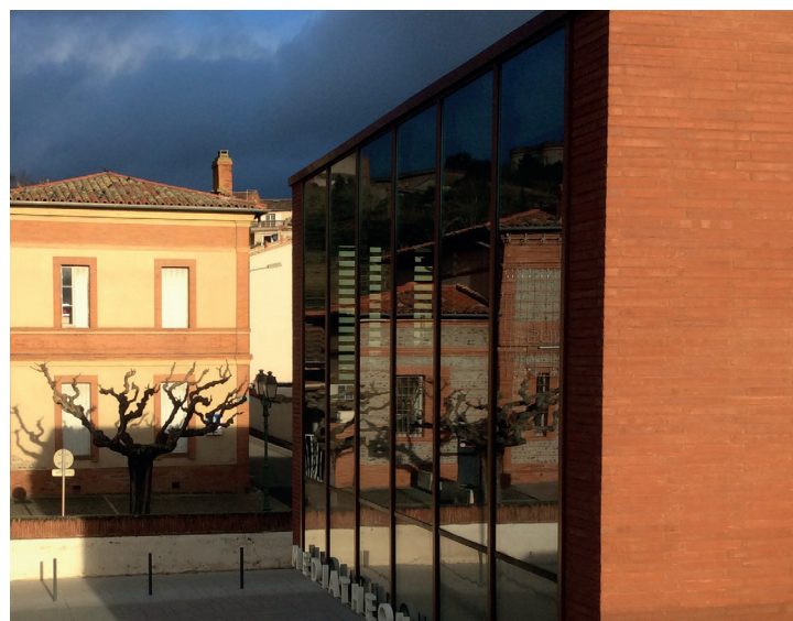
Castelnaud d'Estrétefonds – La médiathèque, élément de requalification urbaine

Le maillage de bibliothèques s'est renforcé en 5 ans. Le réseau de lecture publique est ainsi passé de 145 à 175 structures, fidélisant non plus 80 mais 100 000 usagers « emprunteurs » - les « fréquentants » se développant en sus.