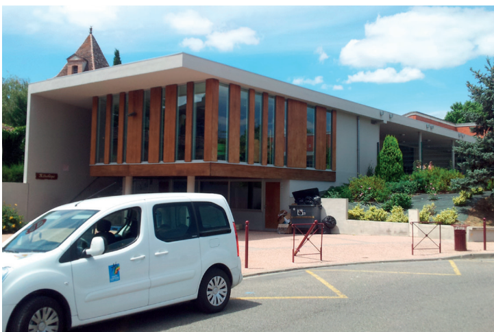
Illusion d'optique : les bibliothécaires de Villaudric vont chercher leurs réservations... à Fronton !

Dès 2024, les Haut-Garonnais pourront ainsi consulter le catalogue de 600 000 livres, DVD, CD et vinyles – réserver ceux qu'ils souhaitent et les voir acheminés en quelques semaines dans l'une des bibliothèques du réseau haut-garonnais 15 .