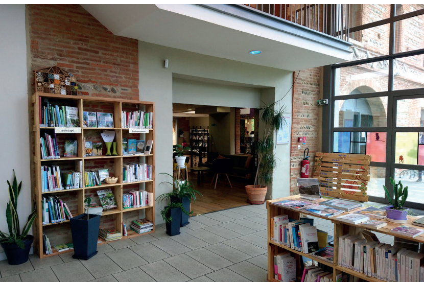
Roques, une partie des collections, espace bien-être du tiers-lieu culturel