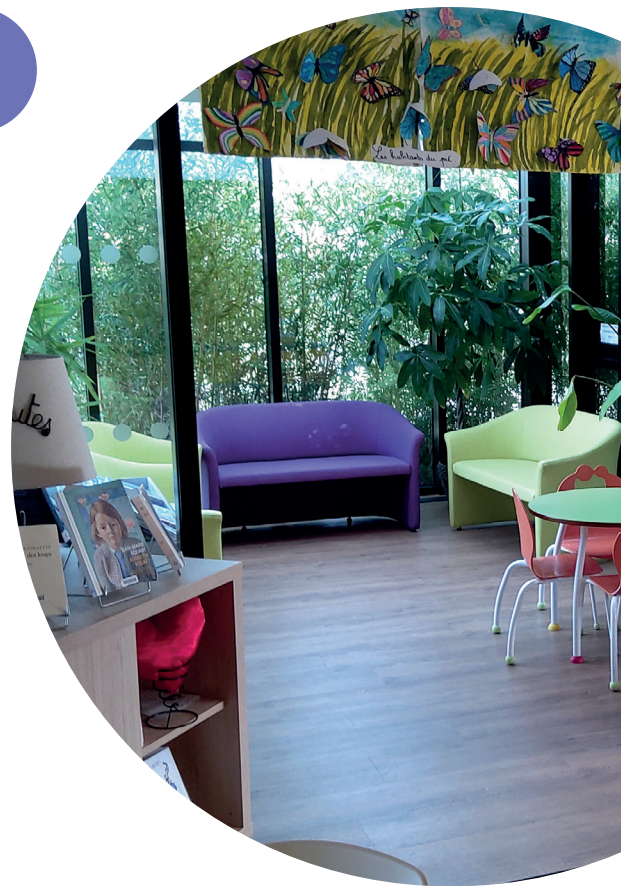
Le Fauga - superbe jardin d'hiver

Médiathèque départementale de la Haute-Garonne