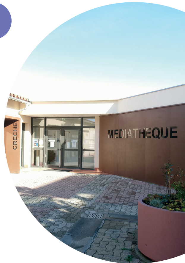
Aussonne - façade médiathèque-crèche, deux services publics essentiels à la vie quotidienne

Médiathèque départementale de la Haute-Garonne