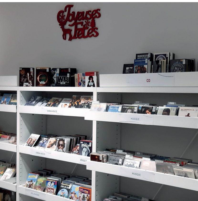
Merville – garder un fonds de musique minimal

Constituées « de documents et d'objets [...] sous forme physique ou numérique », « régulièrement renouvelées et actualisées », représentant « la multiplicité des connaissances, des courants d'idées et d'opinions [...] » et « exemptes de toutes formes de censure » ; enfin, dont « l'accès [...] et la consultation [...] sont gratuits », « à tout public, sur place ou à distance » : les collections sont au cœur de la loi « Bibliothèques », posant même que les orientations générales de politique documentaire des bibliothèques territoriales ont vocation à être présentées devant l'organe délibérant de la collectivité.