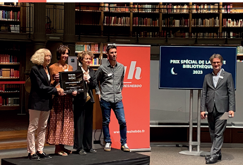
Le Fauga – Prix Livres Hebdo 2023

En posant des critères visant à mieux animer 4 les bibliothèques, le Schéma 2018 « Vers des bibliothèques citoyennes » a contribué à l'amélioration générale de la lecture publique en Haute-Garonne : l'hybridation des usages (implantation du jeu de société, café/thé, grainothèque, prêt d'instruments de musique...) est une réalité chaque année plus pregnante.