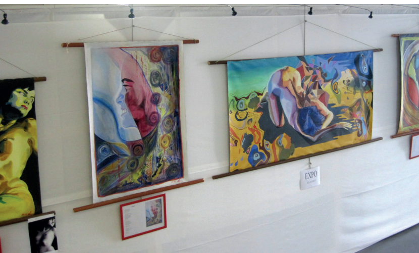
À Nailloux, une programmation annuelle autour de l'art contemporain

Si la lecture publique est un champ d'action publique plutôt modeste « en volumes » (budgétaires, RH...), elle se caractérise par une plasticité remarquable. Ses ressources peuvent facilement contribuer à donner de la matière et du sens à d'autres dynamiques publiques, au premier chef culturelles 10 – par exemple en qualité de facilitatrice des pratiques artistiques en amateur, de par leurs capacités d'accueil de petites formes ou d'enrichissement par leurs collections, leurs prêts d'instruments, etc.